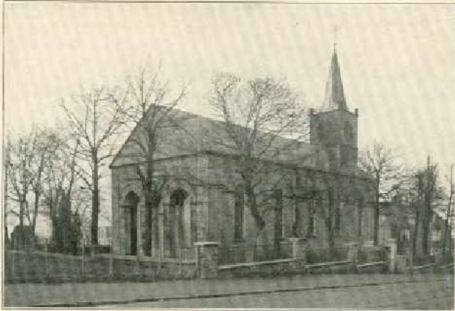
Die Kirche zu Gebetsberg erbaut 1830