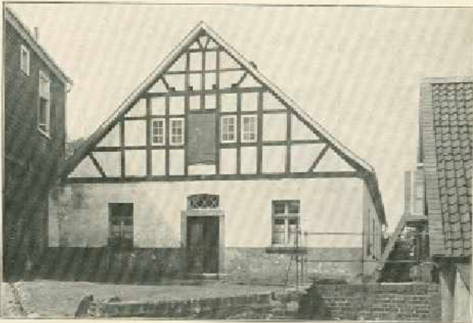
Die Leite 1826 - 1830